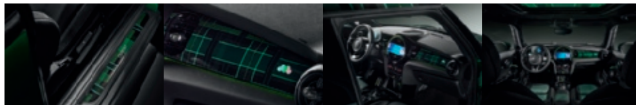
Deurdrempels met mosaert tartan patroon